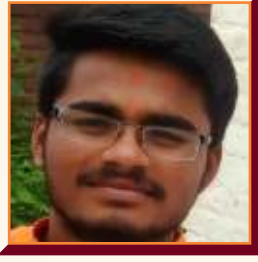
प्रसन्न हणमागाव TE E&TC

लाभले आम्हांस भाग्य बोलतो मराठी । जाहलो खरेचं धन्य ऐक तो मराठी । धर्म, पंथ, जात एक जाणतो मराठी । एवढ्या जगात माय मानतो मराठी ।